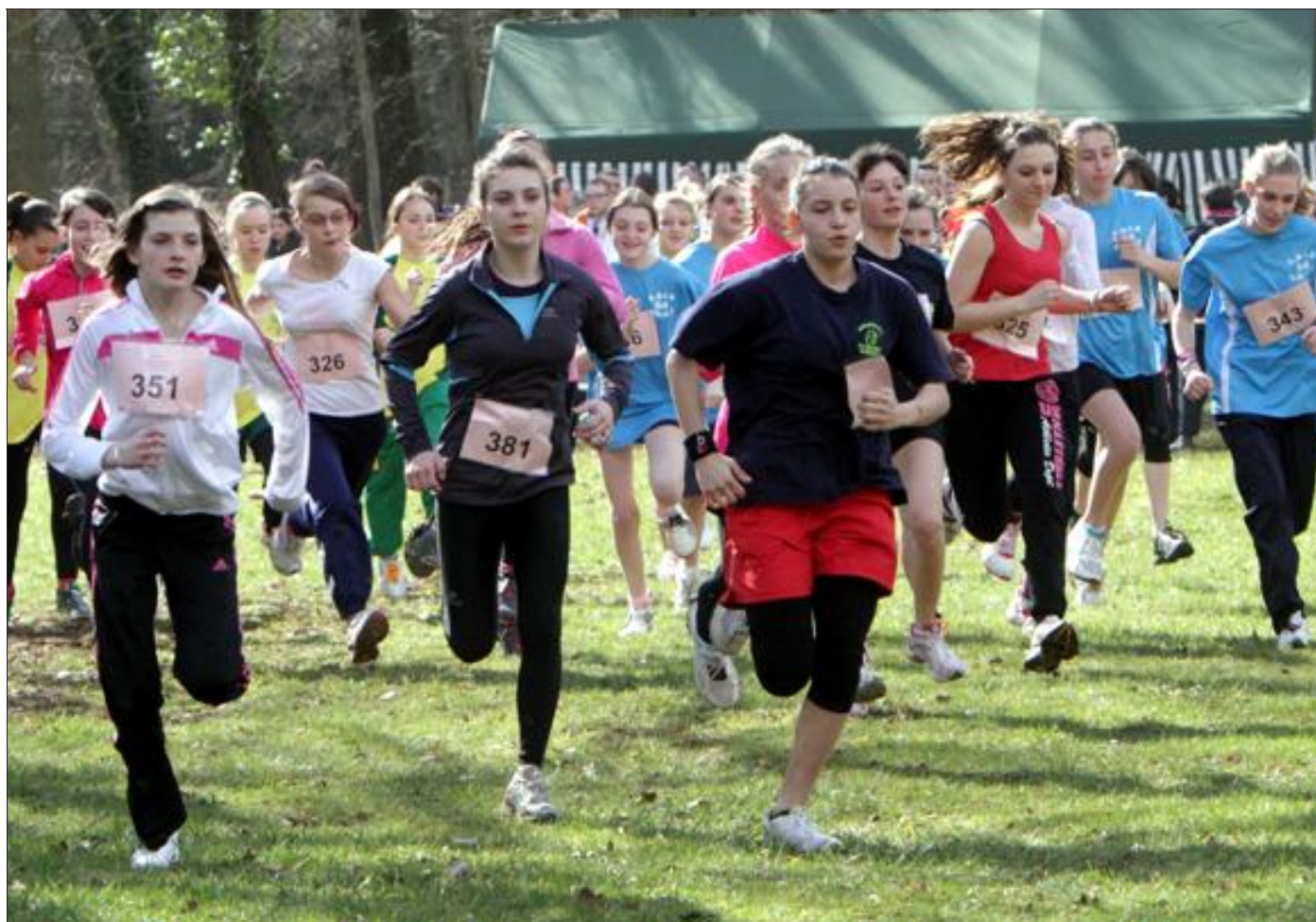
Sous le soleil et les encouragements, les minimes filles s'élancent pour 2,021 km d'efforts.

épreuve régionale hier au domaine de moncel