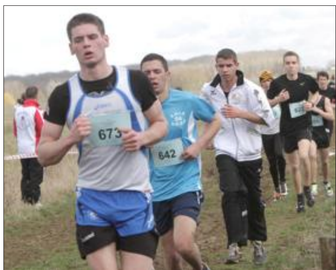
Les cadets en action sur une boucle de 5,367 km. Dans cette course aussi, le rythme a été très soutenu.