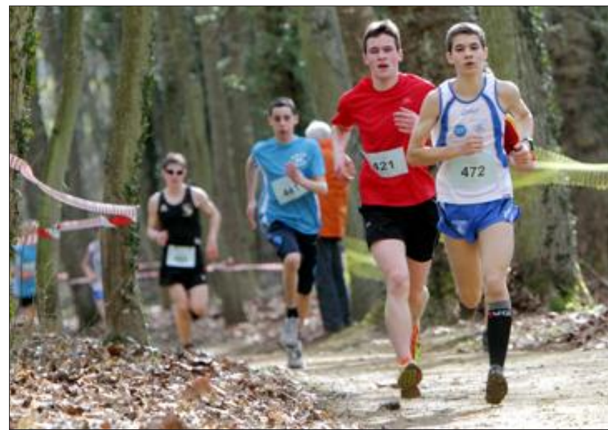
Comme tous les concurrents, les minimes ont évolué dans les allées d'un parc de Moncel se prêtant à ce type d'épreuve.

Hier, le 32 e cross régional des Jeunes sapeurs-pompiers a rassemblé 329 concurrents à Jarny. Soit 76 de moins que prévu. Aux inévitables absences sont venus s'ajouter des forfaits pour cause de dossiers d'engagement non complets (défaut de certificat médical, de carte d'identité...). Avec 46 engagés, la palme du département le plus représenté est revenue à la Meurthe-et-Moselle. Suivent : la Marne (42 coureurs), le Haut-Rhin (40), les Ardennes (37), le Bas-Rhin (35), la Moselle (30), la Meuse (27), la Haute-Marne (26), l'Aube (25) et les Vosges (21).