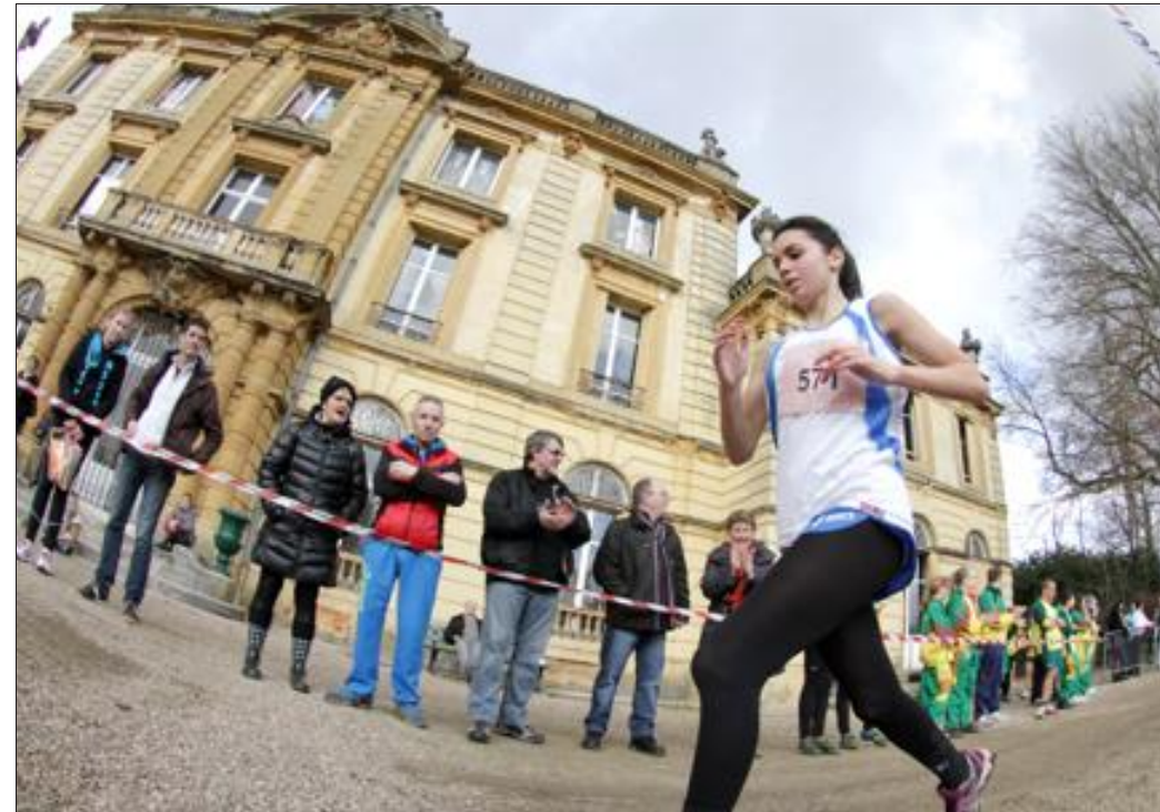
Au pied du majestueux château de Moncel, les organisateurs du cross et leurs nombreux partenaires ont offert aux sportifs des conditions royales.

Aux mains de l'association locale, le rendez-vous a fédéré les énergies. À commencer par celles des nombreux adolescents venus en découdre dans les allées du parc du château. Mais avant de multiplier les efforts, les vedettes du jour n'ont pu faire abstraction de ceux consentis par les organisateurs.