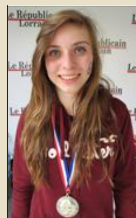
Lise Minery du Haut-Rhin : 2,021 km en 7'33.